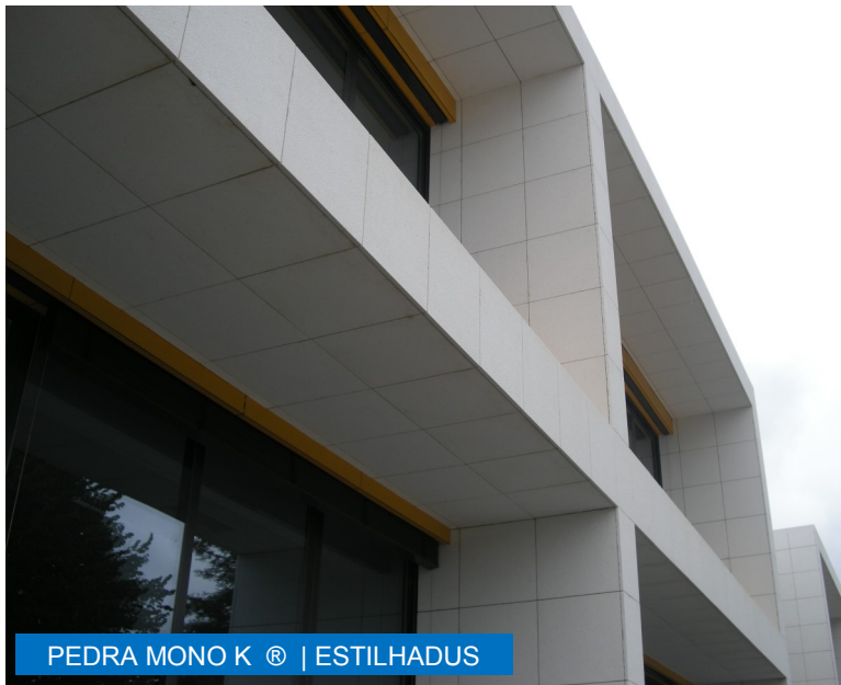
PEDRA MONO K ® | ESTILHADUS