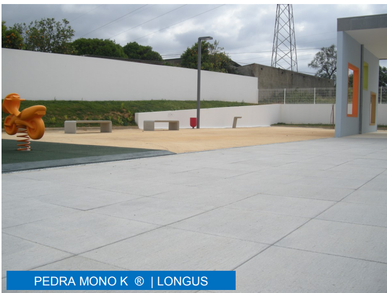
PEDRA MONO K ® | LONGUS