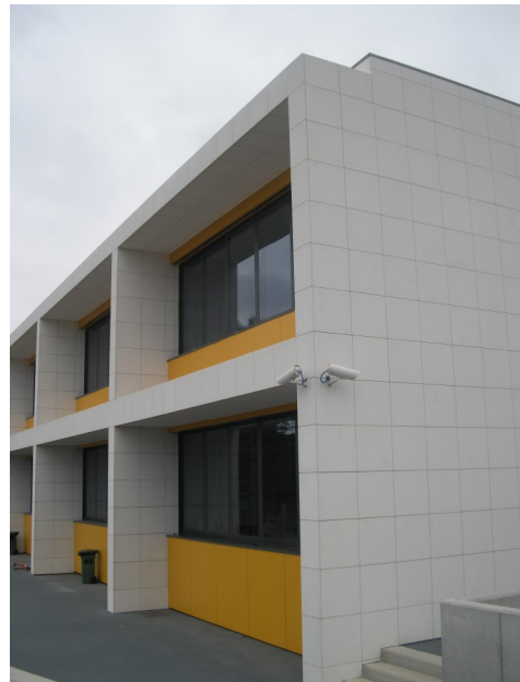
Escola Básica Fernando Guedes — Arquitetura Câmara Municipal de Vila Nova de Gaia